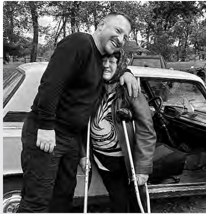
Народний депутат Павло СУШКО під час робочої поїздки Харківщиною.