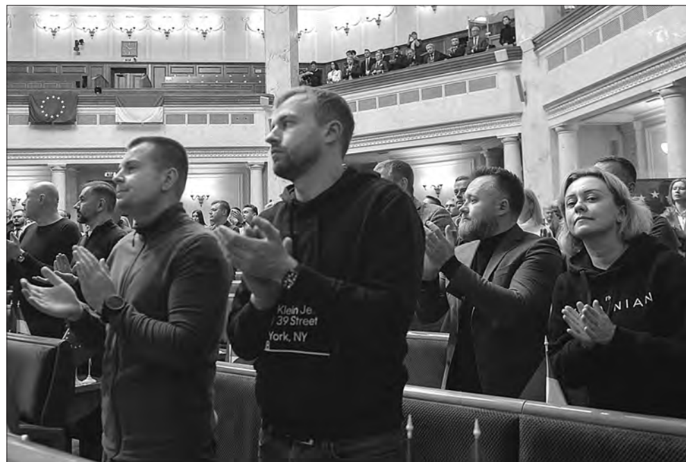
Під час засідання.

Під час виступу в українському парламенті Урсула фон дер Ляєн наголосила, що Україна досягла більшого, ніж можна було очікувати від країни, яка воює.