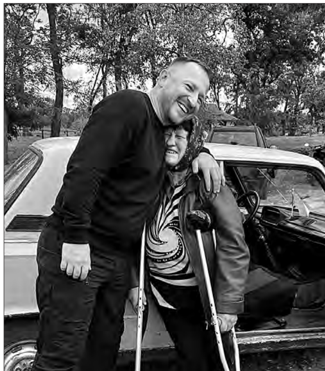
Народний депутат Павло Сушко має чимало фотографій із робочих поїздок Харківщиною. Цей знімок із місцевою мешканкою зроблений у селі Мартове Печенізької селищної громади Чугувського району.

— Із якими проблемами найчастіше до вас приходять люди? — Нині мешканців області найбільше турбує, як працює програма «Відновлення. Ремонт та відбудова житла — ключова проблема для людей, оселі яких зруйновані чи пошкоджені через ворожі обстріли. У цій