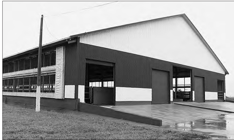
Сучасна молочно-товарна ферма в Квітневому.