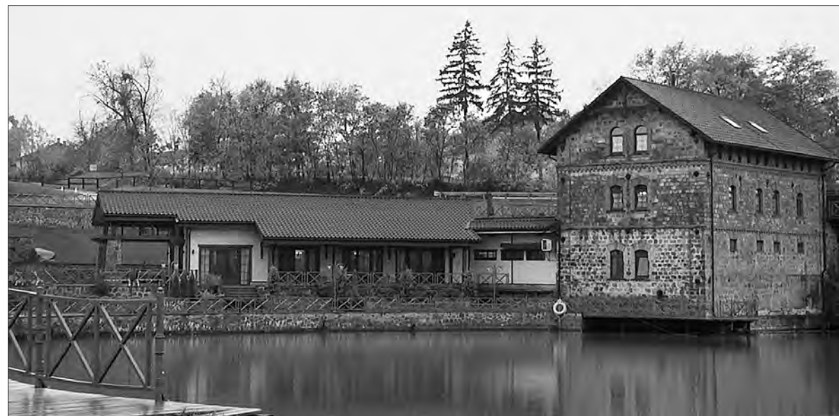
Культурно-розважальний центр «Млин» на березі Унави.