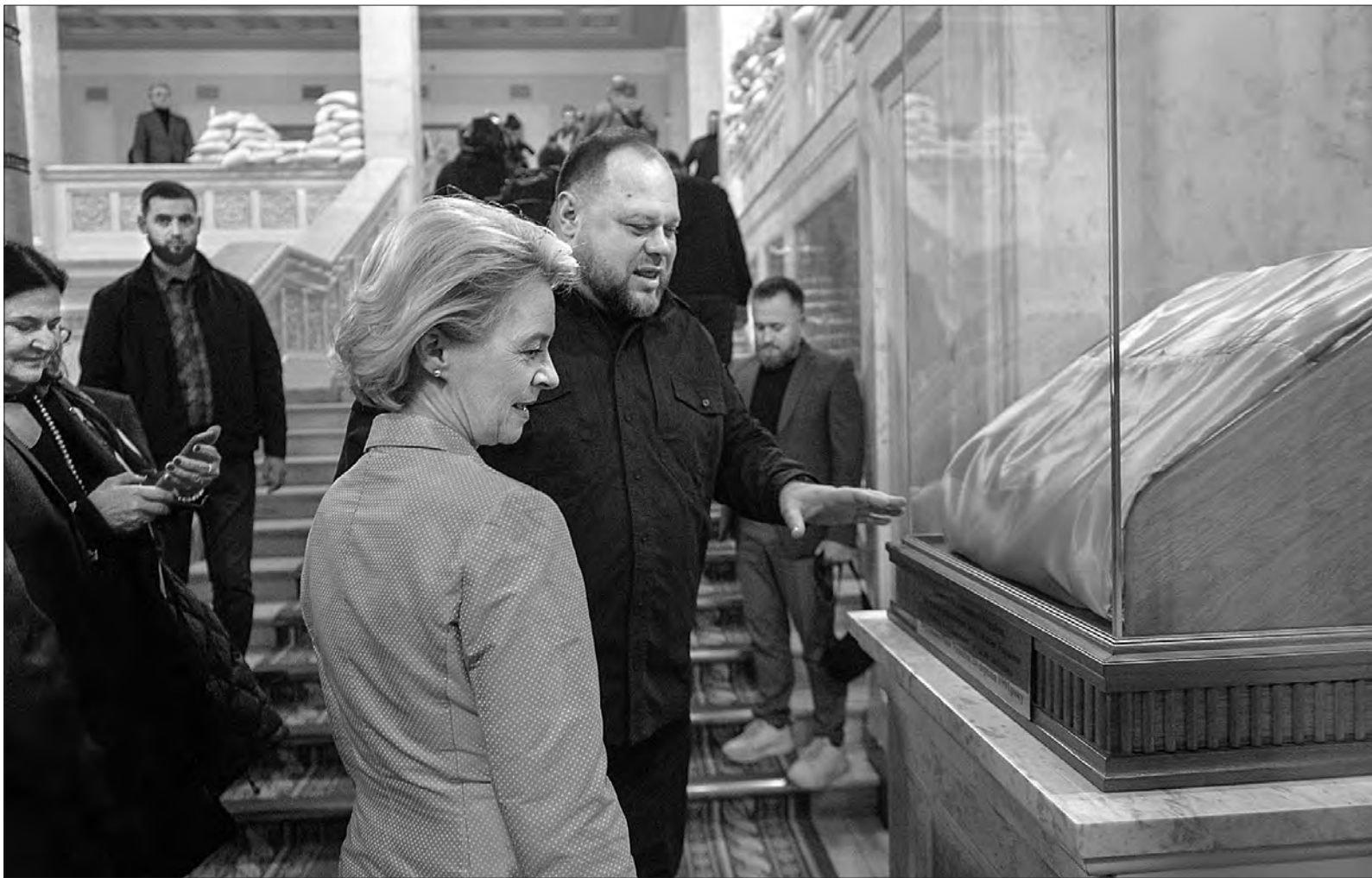
Більше фото — www.golos.com.ua