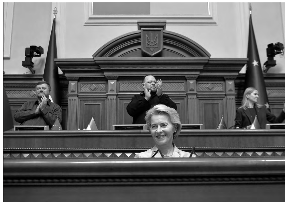
Під час виступу Президентки Єврокомісії Урсули фон дер Ляєн.

Свій виступ Президентка Єврокомісії почала зі згадки про українського військового Олександра Мацієвського, якого російські окупанти розстріляли після слів «Слава Україні».