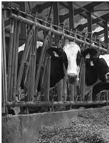
Корів для ферми придбали в елітних господарствах Данії.